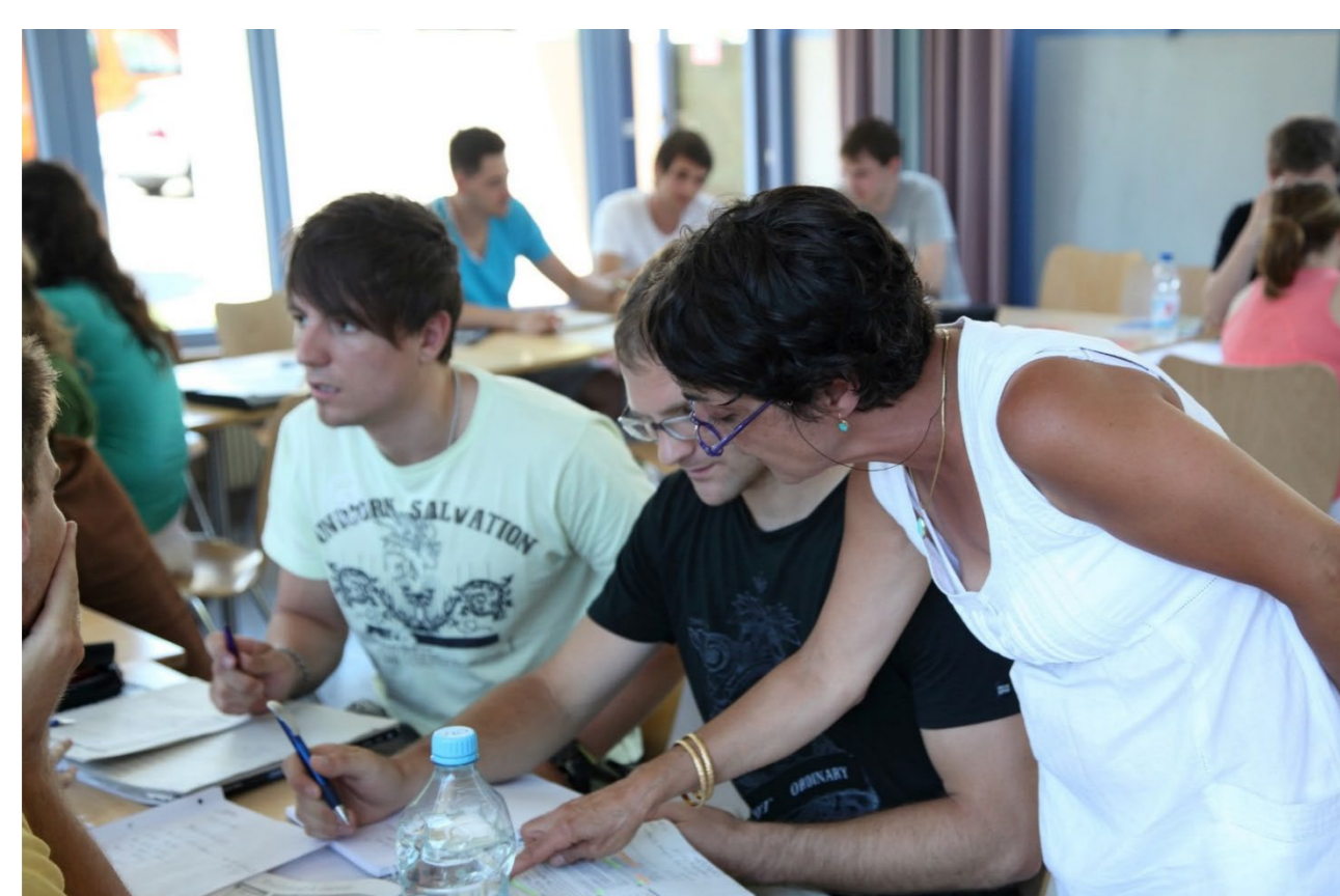
Auf dem Weg zum UNICERT®-Zertifikat

Seit vielen Jahren ist UNICERT® Bestandteil des Hohenheimer Sprachausbildungssystems. Nicht nur das anerkannte Qualitätssiegel, auch die Anreize zur kontinuierlichen Weiterentwicklung des eigenen Angebots und die Möglichkeit, flexibel auf die Bedürfnisse der eigenen Hochschule einzugehen, sind wesentliche Gründe für die Wahl dieses Systems.