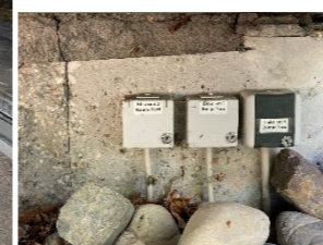
Foto: Der Fußweg ist parallel zur Wetterstation in der Breite freizuhalten. Die andere Grenzlinie bildet der rechte Winkel entlang der Sitzbank/Hecke.

Kontakt für Fragen vor Ort zu den Flächen: Hausmeisterteam Bio/Öko Tel. 0711 459 24448.