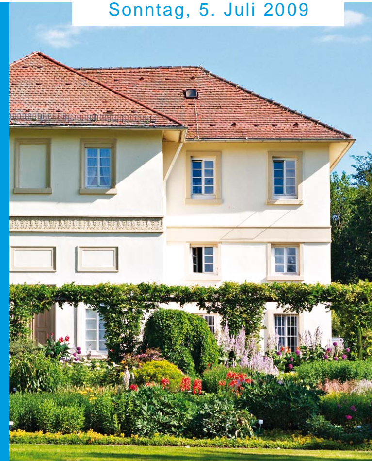
Spielhaus mit Staudengarten