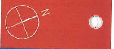
Grundrissübersicht / Erdgeschoss

* Putzabzug berücksichtigt. Nach Wohnflächenverordnung. Möblierung beispielhaft und nicht im Kaufpreis enthalten. Bad- und Küchenmöblierung inklusive.