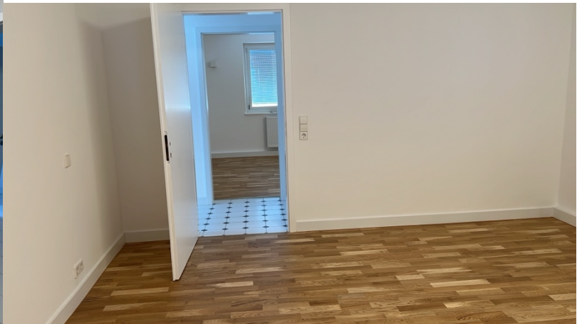
Blick in die Zimmer