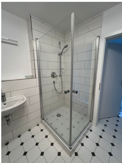
Blick ins Badezimmer