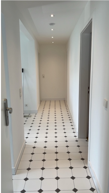
Eingang, links offene Küche