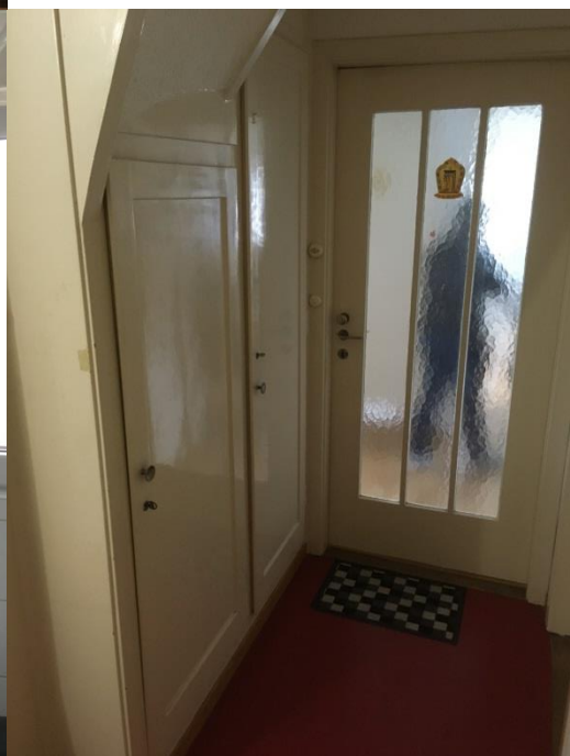
Eingangsbereich zur Wohnung mit Einbauschränken