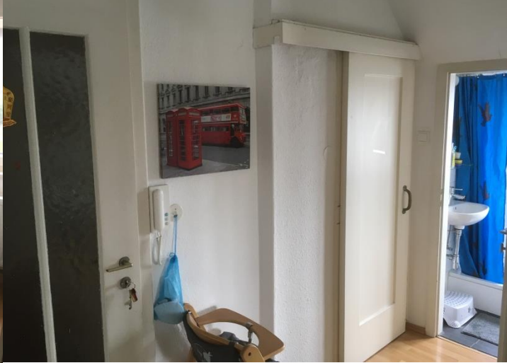
Flur mit Blick ins Badezimmer und Schiebtür zur Küche