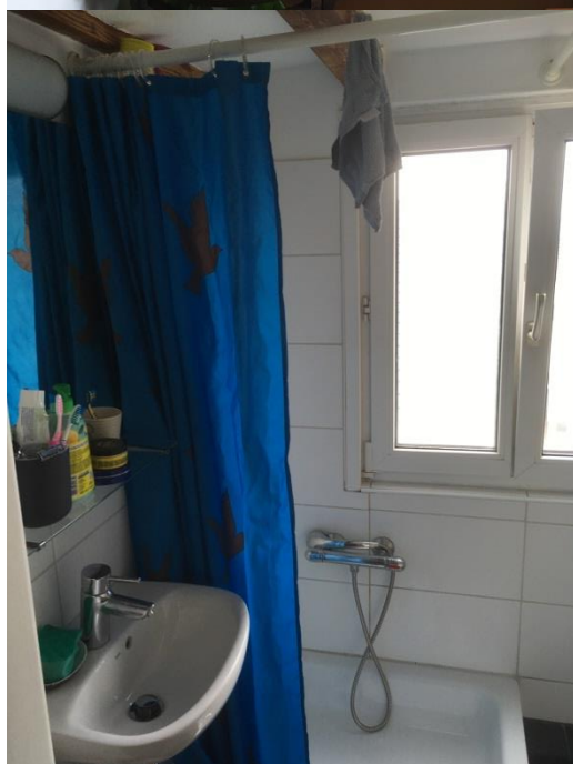
Tageslichtbad mit Dusche, Waschbecken und WC